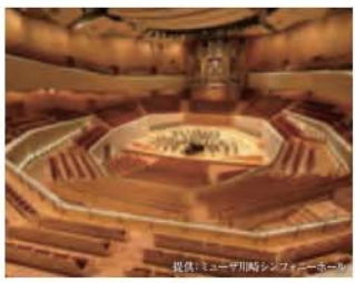
ミューザ川崎シンフォニーホール 約3,490m / 自転車で14分 【幸区大宮1310】