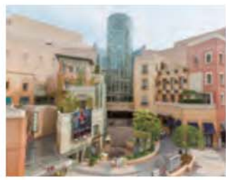
ラ チッタデッツァ 約3,790m / 自転車で16分 【川崎区小川町4-1】 チネチッタ(映画館)、チャペル & パーティー会場、ショップ&レストラン等