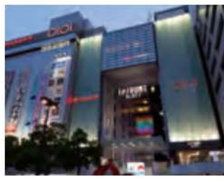
川崎ルフロン 約3,850m / 自転車で16分 【川崎区日進町1-11】 丸井川崎店、ヨドバシカメラ等 営業時間 / 10:30~21:00、レストラン11:00~23:00