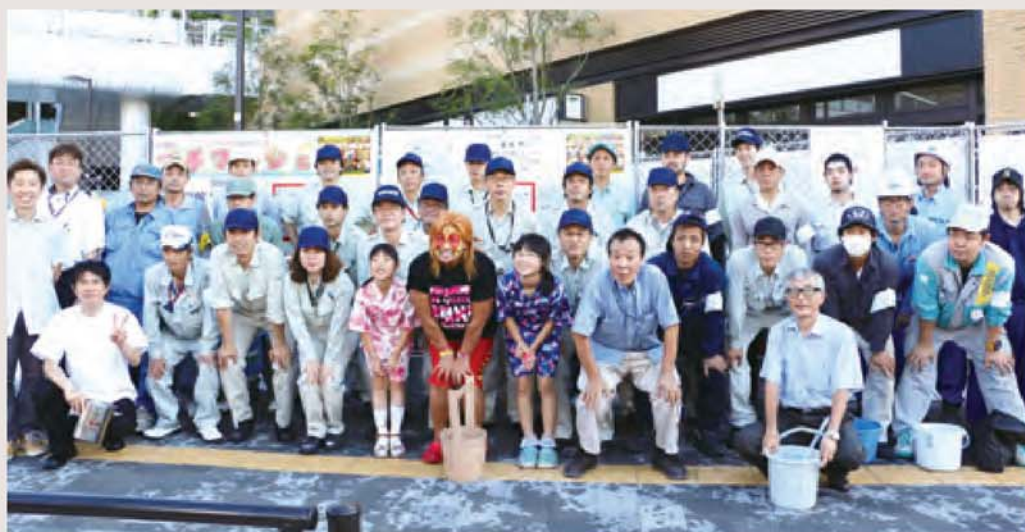
2016年7月打ち水イベントの様子

鹿島田商店会では地元のお祭りに参加する他、地域と連携して毎年様々なイベントを行なってきました。少しでも心地よい街、活気ある商店会になればと願っています。いろいろな場所で多くの方に会って気軽に情報交換しながら、これからも住みよいまちづくりを目指していきたいと思っています。