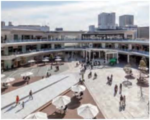
ラゾーナ川崎プラザ 約3,330m / 自転車で14分 【幸区堀川町72-1】 営業時間 / 専門店10:00~21:00、 飲食店11:00~23:00 ダイニング・セレクション10:00~22:00