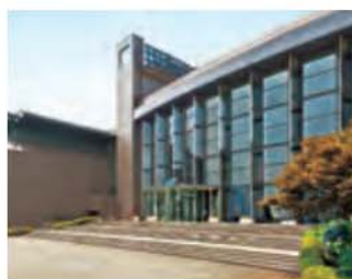
市民ミュージアム [等々力緑地内 約5,220m]