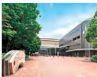
とどろきアリーナ [等々力緑地内 約5,220m]