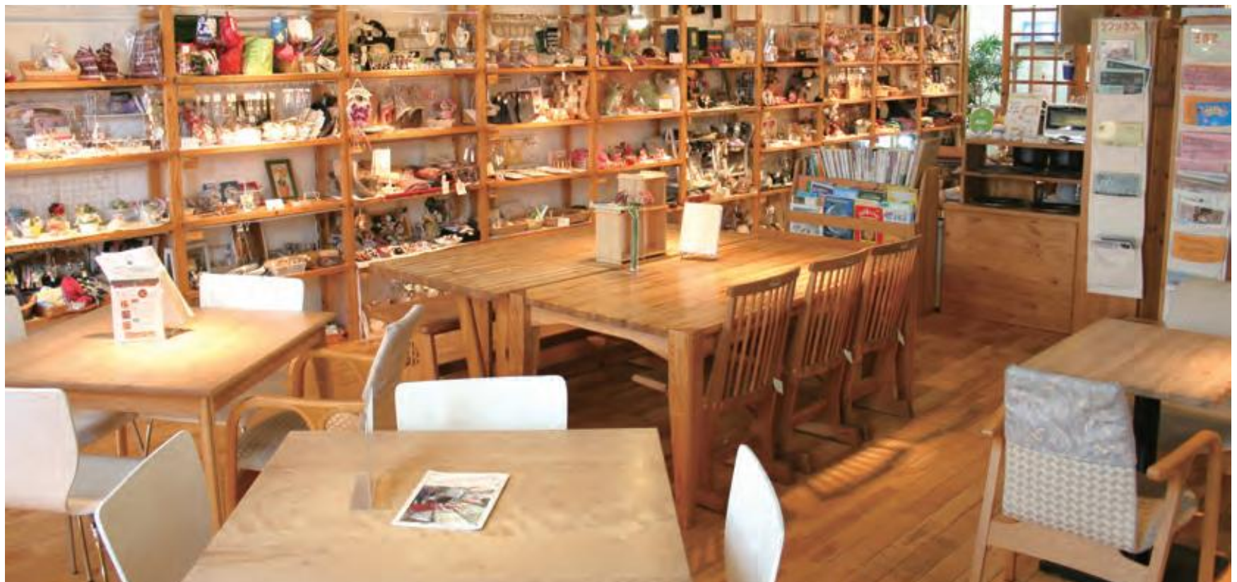
姉妹店 港南台タウンカフェ