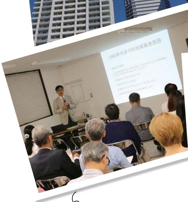
地域を知る勉強会