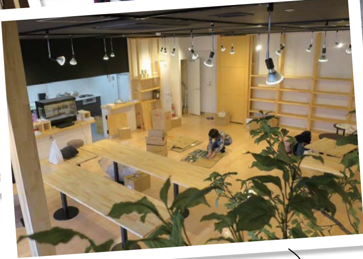
まちの交流拠点タウンカフェ