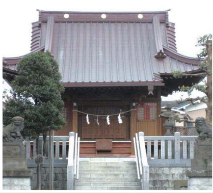
㊦ ● 鹿島大神

新川崎・鹿島田を楽しもう！ 読者と地元レポーターが選んだ、 昼を楽しむまちのマップ